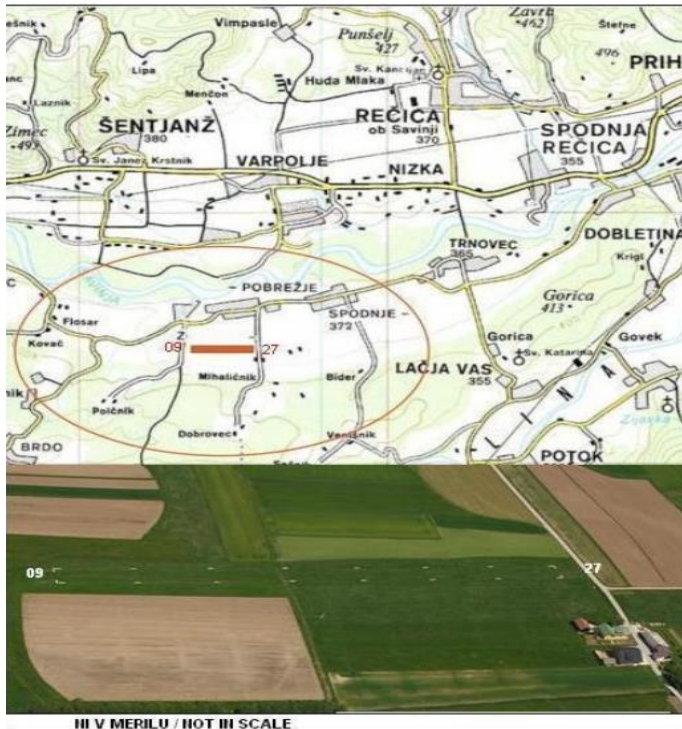
Slika 2: Vzletišče Pobrežje - Zg. Pobrežje (občina Rečica ob Savinji)