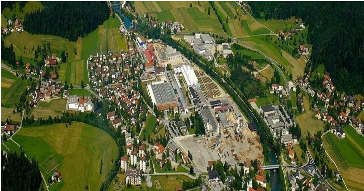
Slika 3: Občina Nazarje

Najhujše posledice v občini Nazarje lahko povzroči nesreča oziroma padeč večjega potniškega letala na najbolj naseljeno oziroma urbanizirano območje in to je v ravnini vodotoka Drete (Zadrečka dolina) in njenega sotočja s Savinjo, kjer je tudi umeščeno občinsko središče Nazarje. V Zadrecki dolini prevladujejo gručasta naselja in manjši zaselki ter razpršena poselitve. Severno in južno od Zadrecke doline se razteza gričevnato in hribovito obrobje z manjšimi zaselki in razpršeno poselitvijo. V primeru iskanja pogrešanega zrakoplova in oseb, bi predstavljal velik problem iskanje zrakoplova, reševanje in pomoč v težje dostopnih gozdnih predelih v predelu Savinjskih Alp.